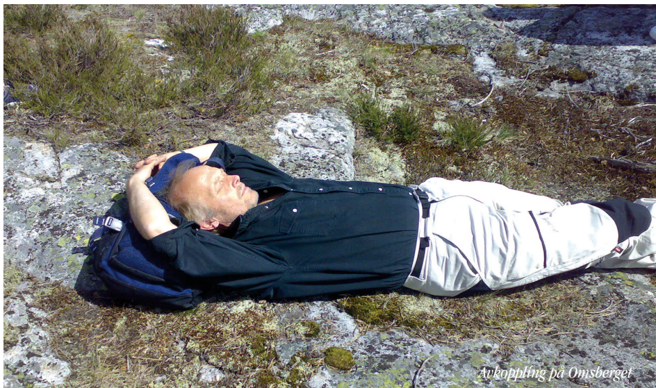
Avkoppling på Omsberget

Från Kvissleby: ta av från E4 västerut på Tunavägen, kör ca 3 km och sväng in mot Tallstugan. Sen är det drygt 2 km kvar till stugan.